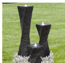
Vattensten Torso 3-set Höjd: 30/60/90cm