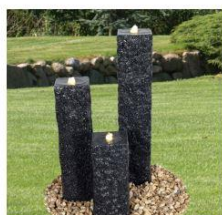
Vattensten Granit 3-set Höjd: 50/75/100cm (20x20cm)